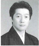
賛助出演 花柳 登貴太郎

【和楽器体験コーナー】開演前の一時間に、舞台上で実際に演奏する鼓や太鼓に触れていただける体験コーナーを、大ホール前ロビーにて開催します。出演する演奏者がご案内をさせて頂きますので、この機会に生の音を体験してみてください。